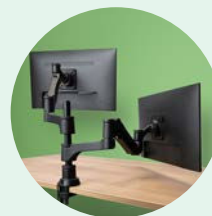
R-Go Caparo/Zepher Twin