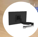
R-Go Dodatkowe ramię