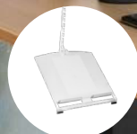
R-Go Morelia Uchwyt na dokumenty