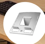
R-Go Morelia Uchwyt na notebooka